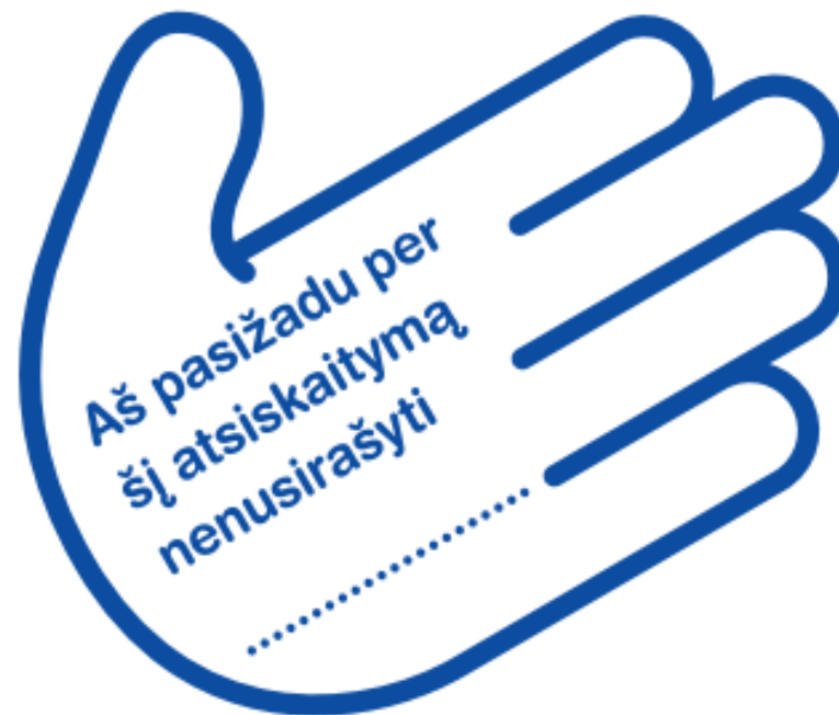
1 pav. Tokius lipdukus naudojo moksleiviai eksperimento metu.